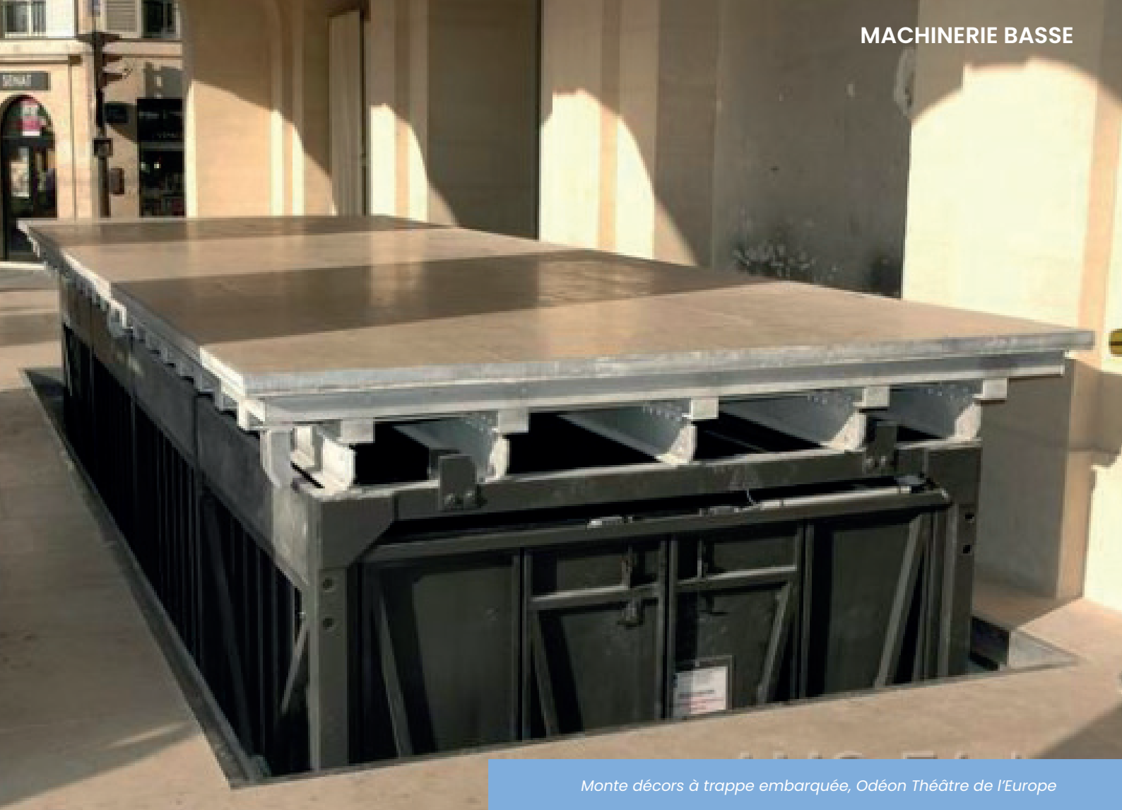
Monte décors à trappe embarquée, Odéon Théâtre de l'Europe